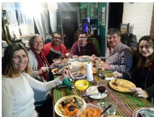
Con compañeros/as del COR y el Foro Infancia Robada en Buenos Aires