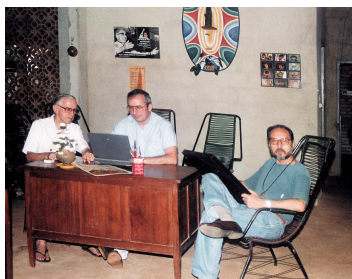
Los tres mosqueteros, como decía Pedro.