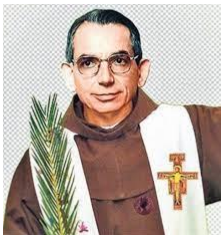
Beato Fray Cosme Spessotto