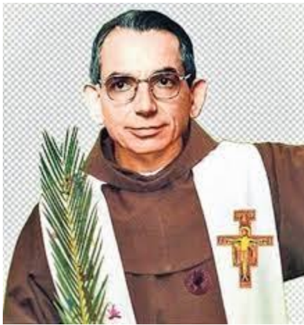
Beato Fray Cosme Spessotto