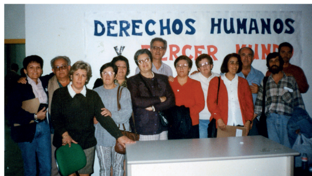
Siempre por los Derechos Humanos