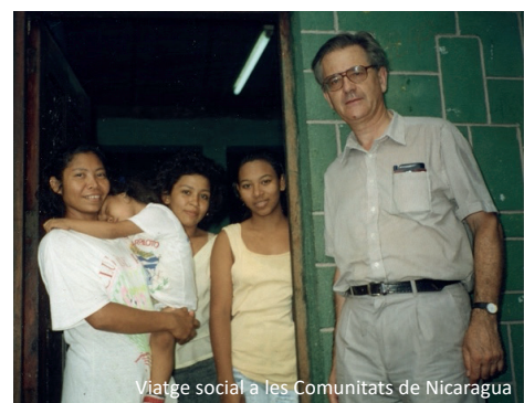
Viatge social a les Comunitats de Nicaragua