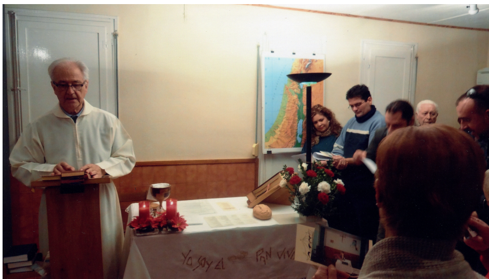
Celebració a la capella de La Floresta, 2013.