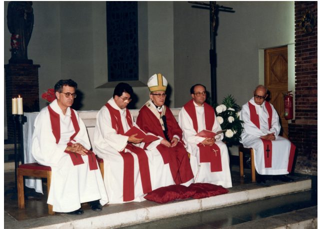
Celebració a Torreforta amb l'Arquebisbe Pont i Gol, 1988.

En segon lloc podem parlar de la seva vessant docent. Els deixebles de sant Ignasi, ja des de la primera generació, tenen la vocació de l'ensenyament. Es concreta en tants centres i en tantes vessants que de manera capil·lar es troben en totes les disciplines. El pare Xammar no eludí aquesta faceta, que va exercir durant molts anys a diferents centres de casa i també a les vacances a Llatinoamèrica, on s'hi movia amb molta naturalitat. I també, en xerrades de formació per elevar el nivell intel·lectual i formatiu, especialment dels laics. El món de la filosofia era una matèria on s'hi movia plàcidament per tal de fonamentar, raonar, discutir i rumiar