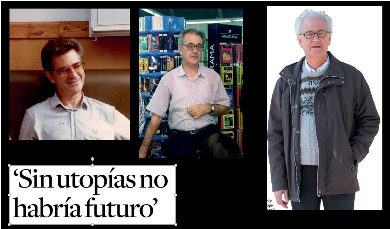
I va donar el millor d'ell mateix

altra opció per acostar-me al món del treball. Vivint aquestes experiències, t'enriqueixes humanament.