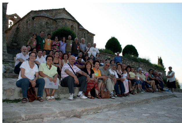
Jornades estatals dels CORs a Sta Margarida, 2010.