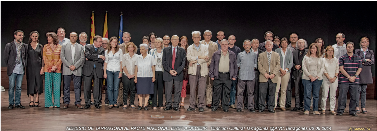
ADHESIÓ DE TARRAGONA AL PACTE NACIONAL DRET A DECIDIR. Òmnium Cultural Tarragonès @ANC.Tarragonès 06 06 2014