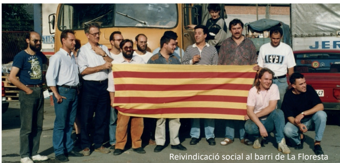
Reivindicació social al barri de La Floresta