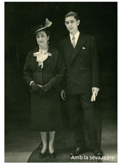
Amb la seva mare