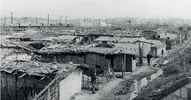
Barri Entrevies - Torreforta 1964 on va començar la vida pastoral i social.