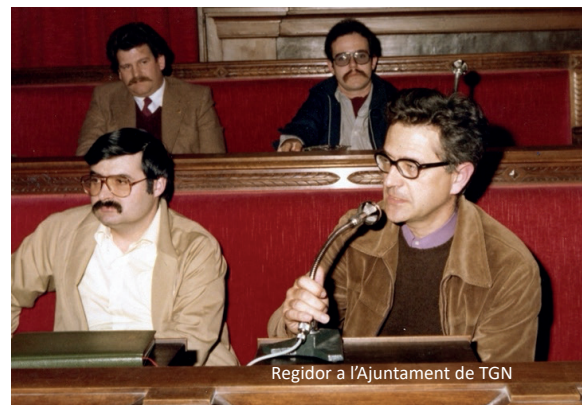
Regidor a l'Ajuntament de TGN