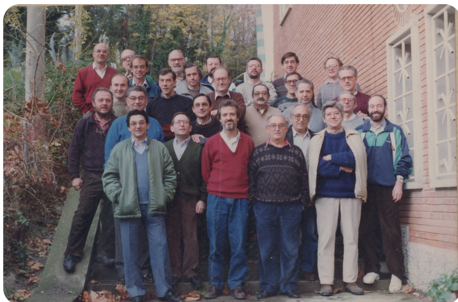
Amb els companys jesuïtes al 1992