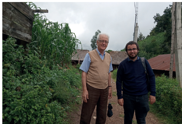
Amb l’autor d’aquest article a Guatemala, 2019.

Els orígens dels seus vincles amb Llatinoamèrica es remuntaven a començaments dels vuitanta, quan la revolució sandinista havia desbancat del poder el dictador Somoza i havia despertat l’interès dels sectors més esquerranosos. Xammar també va mi-