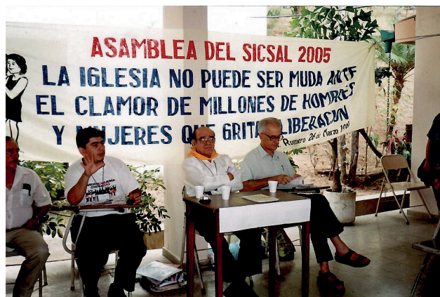
Asamblea SICSAL 2005.