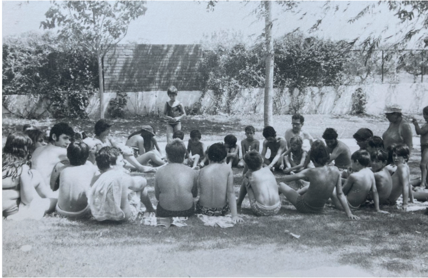
Colònies amb el joven de La Floresta. 1975

pecialment rellevant avui: un exemple de presència cristiana lliure, no partidista i profundament ètica en la vida pública”.