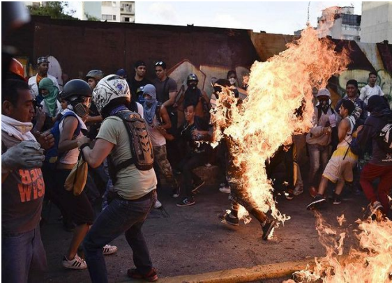
Chavista quemado vivo en Plaza Altamira, municipio Chacao

Afirmaba en estos días la opositora María Corina Machado: “La salida debe producirse de cualquier forma”. Estos agresivos opositores saben muy bien que los actos violentos que han propiciado acarrearían terribles consecuencias, pero su odio racial -transmitido a sus seguidores- y sus ansias por recuperar las riquezas del país, de las que se creen sus únicos herederos, les llevan a despreciar la vida humana, el sufrimiento de las personas y la democracia. La paz es su peor aliada, porque la estabilidad y progreso que conlleva los condena a ser unos ciudadanos más, con sus inmensas riquezas sospechosamente conseguidas antaño, pero unos ciudadanos que estarían sometidos a unos gobiernos dirigidos por el pueblo. Y su infinita soberbia no se lo permite.